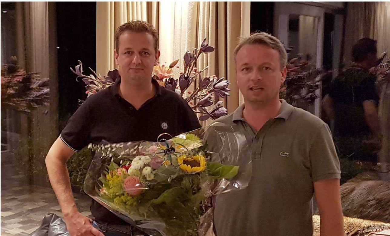
Derksen-v.d. Keuken, Almelo